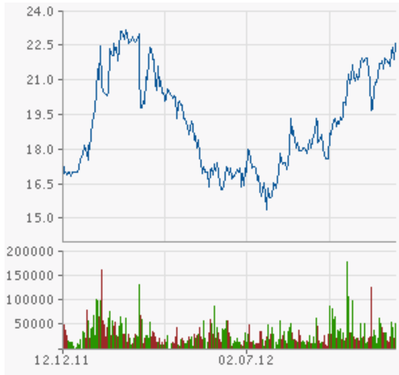
Details zur Aktie AFG Arbonia-Forster-Holding