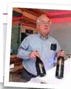
Weinliebhaber Der Patron steht gerne in der Küche.