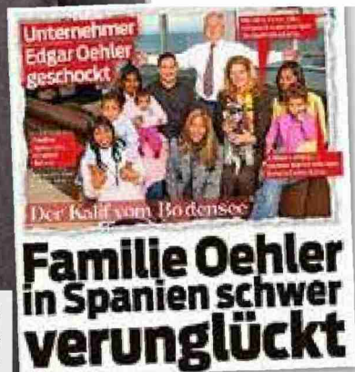
Schicksalsschlag 2010 Frau und zwei Töchter schwer verletzt.